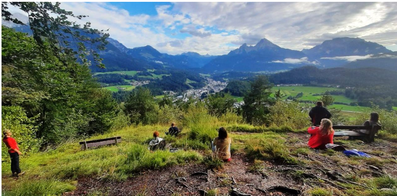
Der Garten der Percht

Mindestteilnehmerzahl 6 Personen, maximale Teilnehmerzahl 15 Personen.